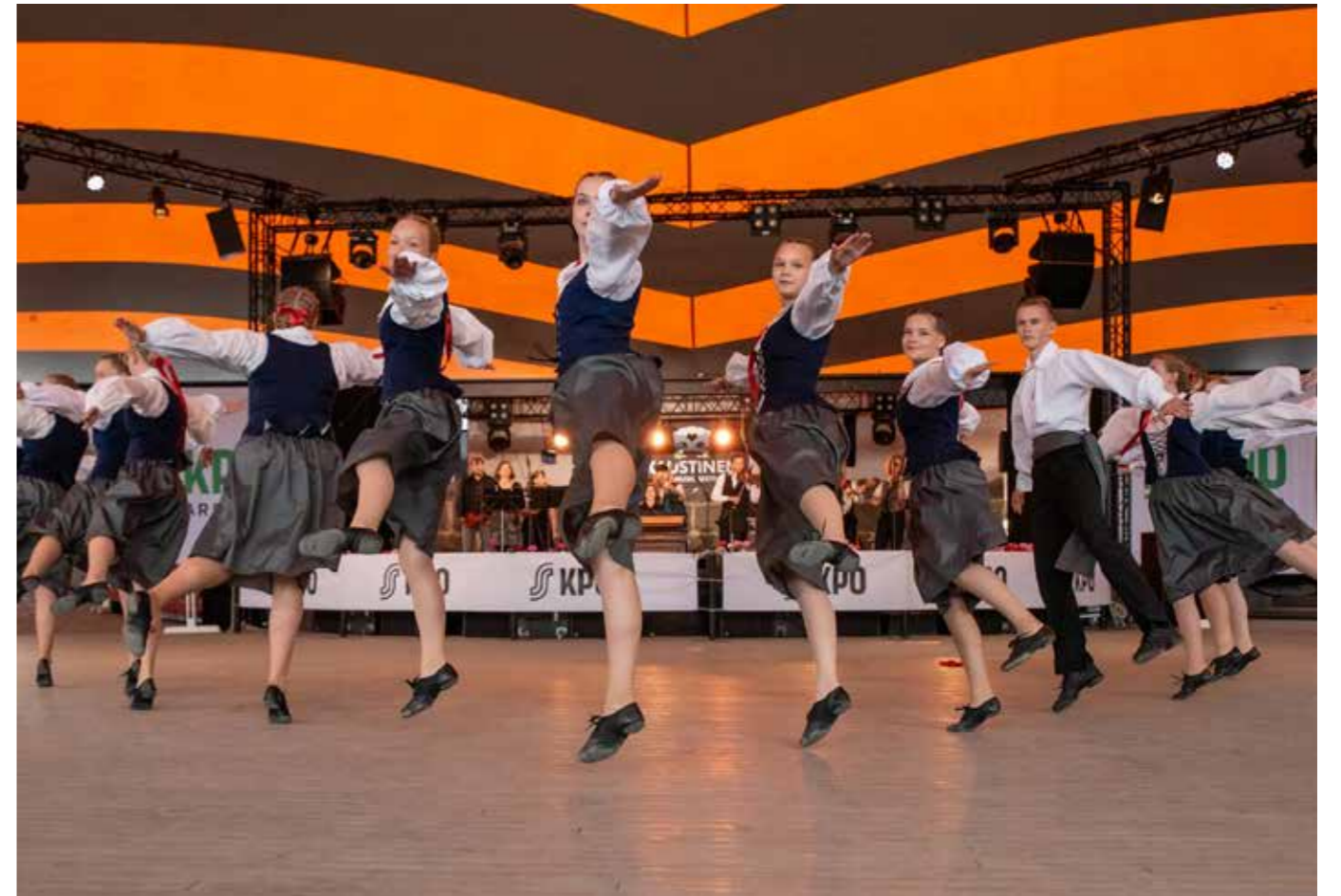
Ottoset KPO-areenalla.