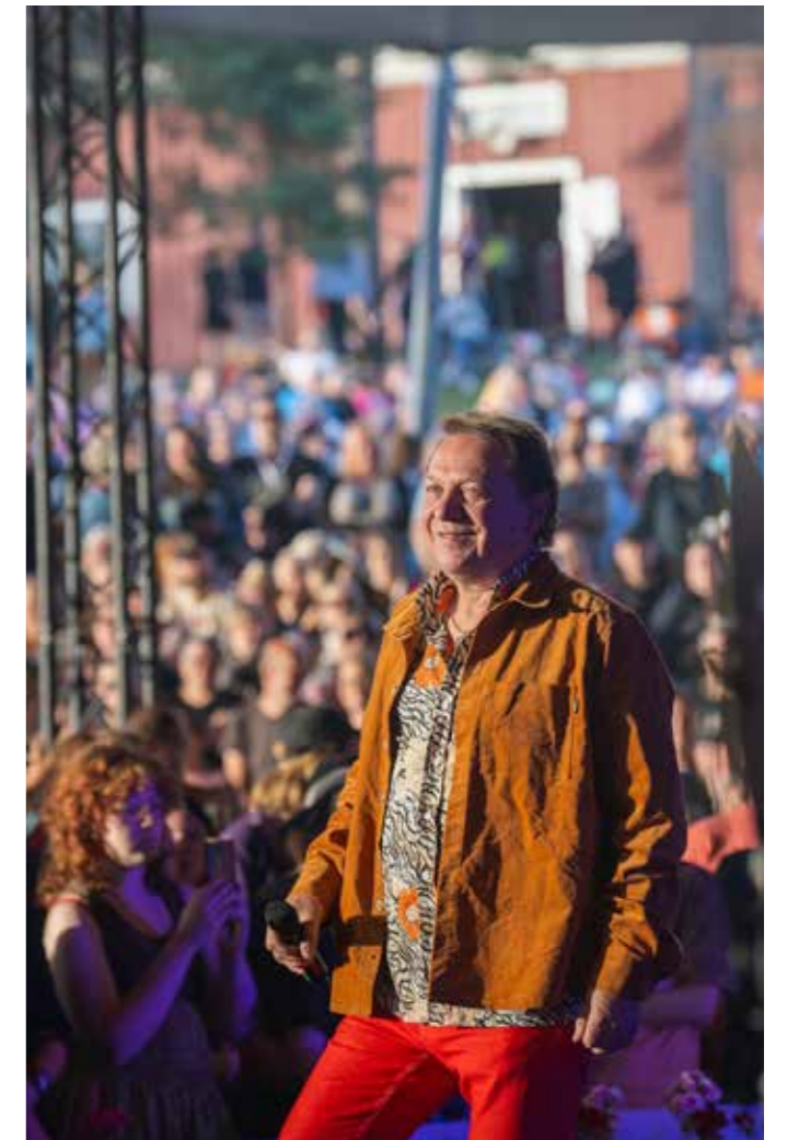
Miljoonasade KPO-areenalla.