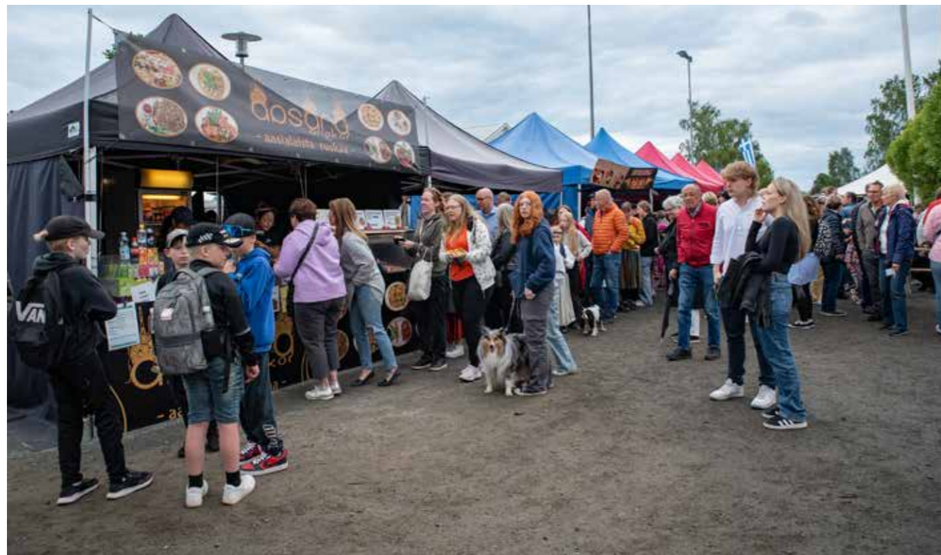
Ruokakujan tunnelmaa.