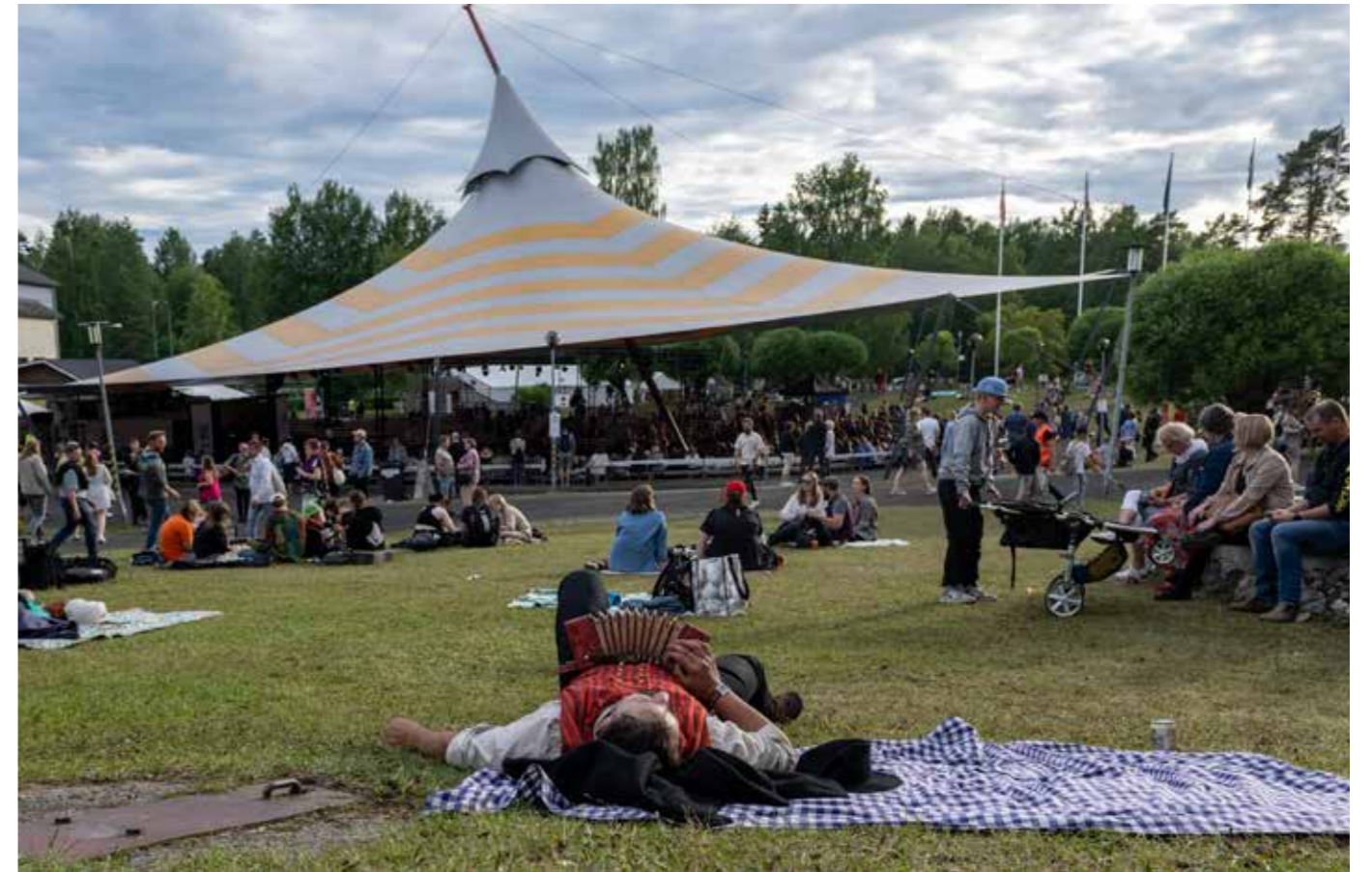
Lepohetki rinteessä.