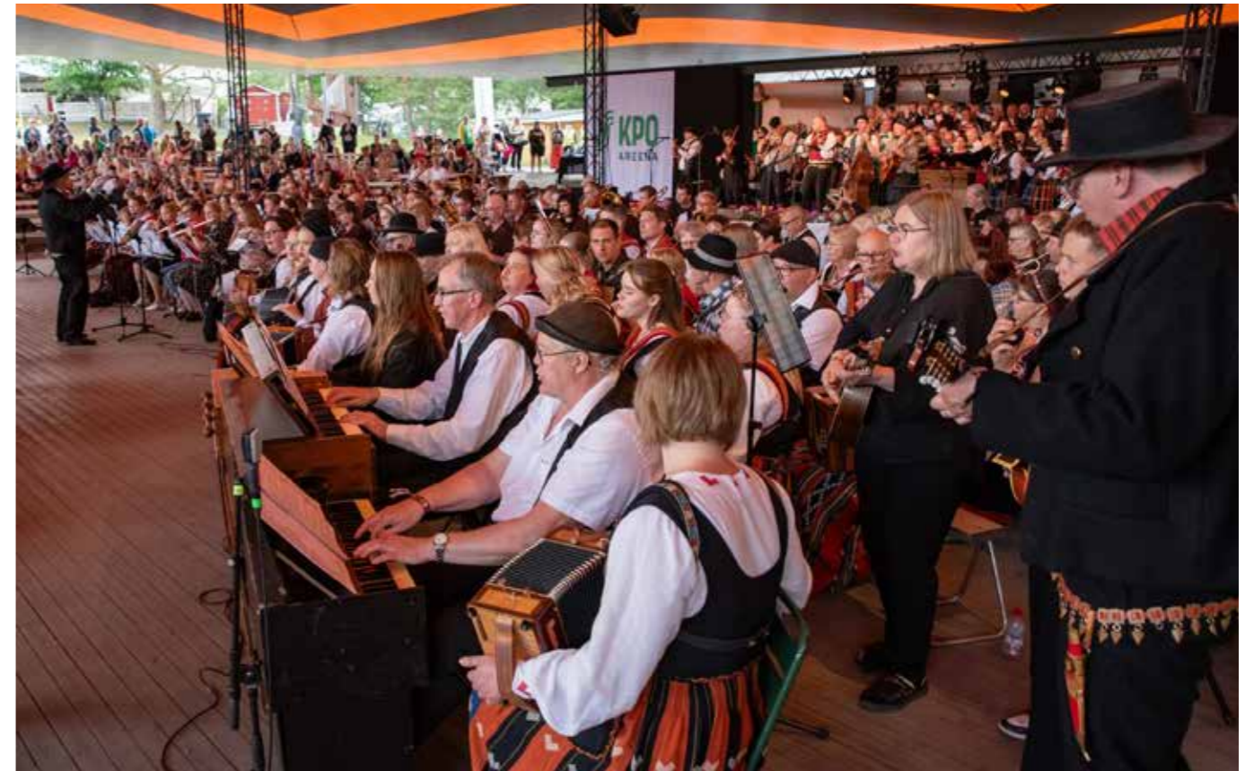
Pikkuusen paree - maakuntateeman pääkonsertti Areenalla.

Aineettoman kulttuuriperinnön ilmiöitä esiin tuova Elävän perinnön teema on ollut jo vakiintunut tärkeäksi osaksi tapahtuman ohjelmaa. Teemaan liittyviä ohjelmasisältöjä tuotetaan yhteistyössä vuosittain vaihtelevasti eri toimijoiden kanssa. Joka-vuotinen ja tärkein yhteistyötaho on Kansanmusiikki-instituutti.