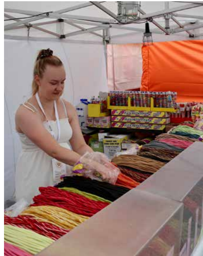
Lakua, lakua.