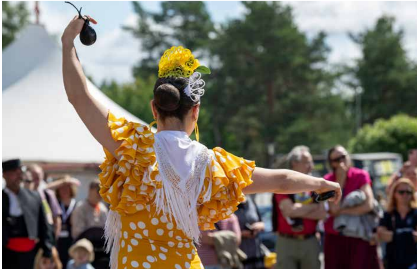
Grupo de coros y danzas Francisco de Goya (ES) Juhlapihalla.