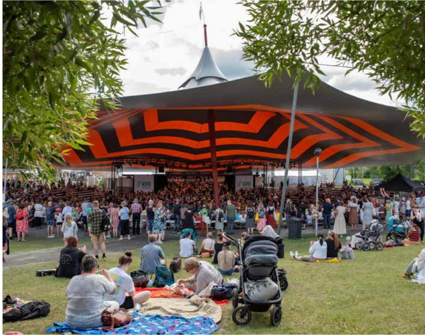
KPO-areenan tunnelmaa.

Finland Festivals valitsi Kaustisen kansanmusiikkijuhlat vuoden festivaaliksi 2024. Tunnustus myönnetään vuosittain merkittävästä taiteellisesta kehityksestä, huomattavasta taiteellisesta saavutuksesta tai lupaavasta läpimurrosta.