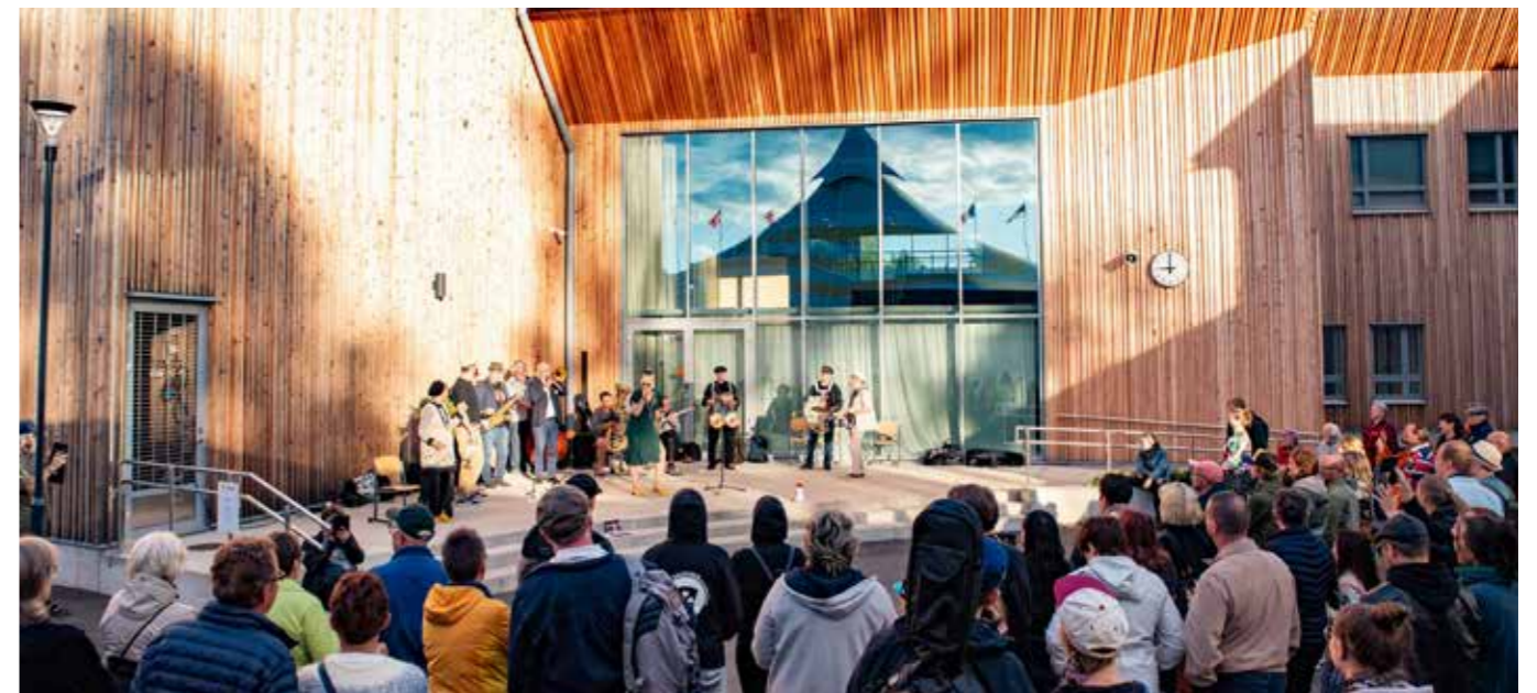
Roamin' Street Band Sopukassa.

Perhemajoitusta kehitettiin yhdessä majoittajien kanssa toimivammaksi kokonaisuudeksi. Mahdollisuutena oli tarjota huoneen lisäksi myös asuntoauto- ja telttapaiikkaa. Perhemajoittajia oli 40 Kaustisen ja Vetelin alueella. Yleisömajoituksen osalta yhteistyötä tehtiin myös Kaustisen Kehitys oy:n (Hotelli Kaustinen) kanssa.