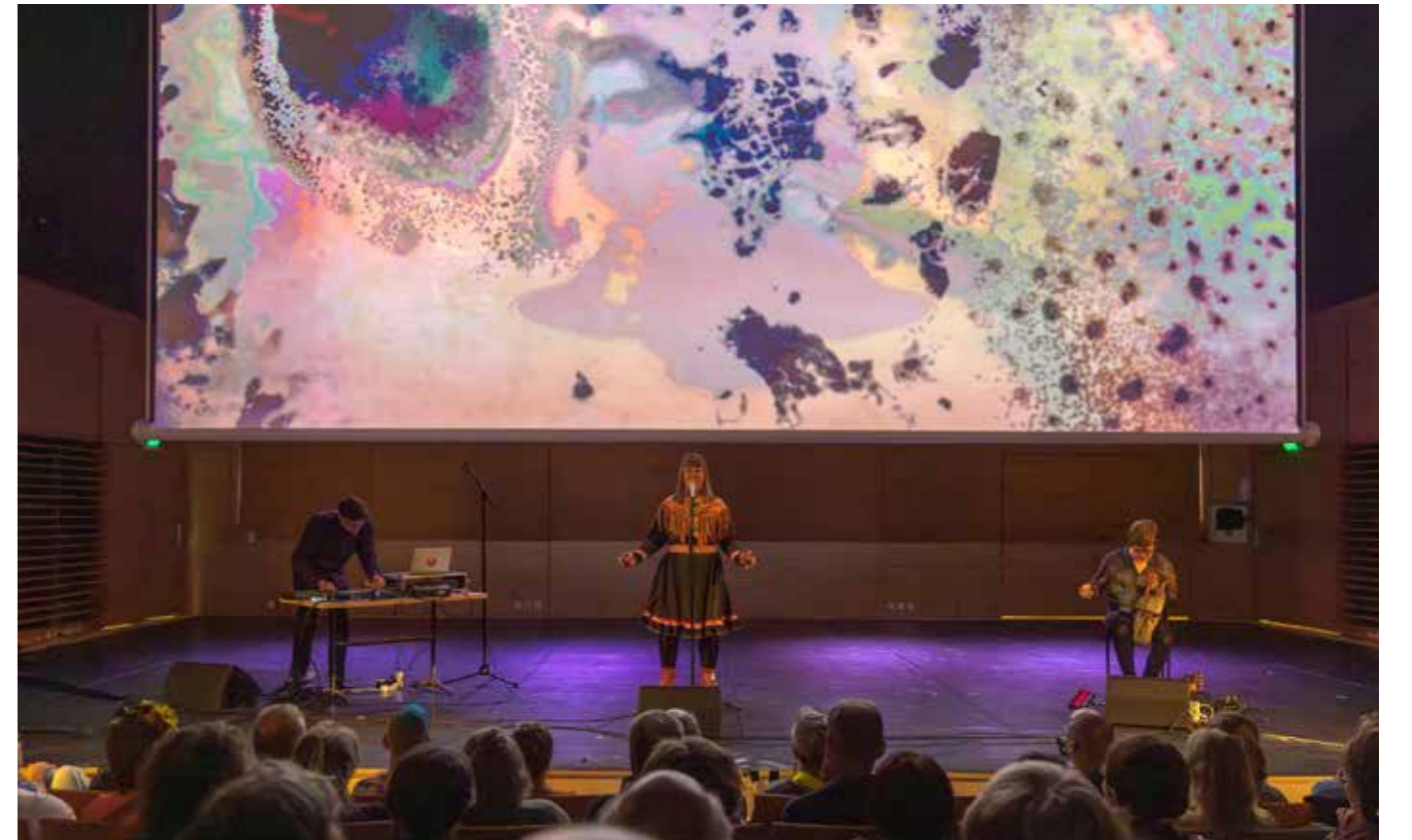
Annámáret Kaustinen-salissa.