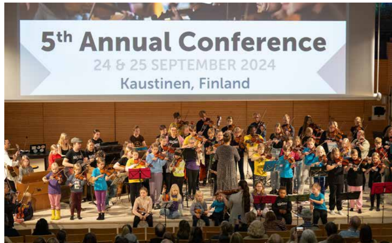
Näppärit esiintymässä EFN seminaarissa 2024.