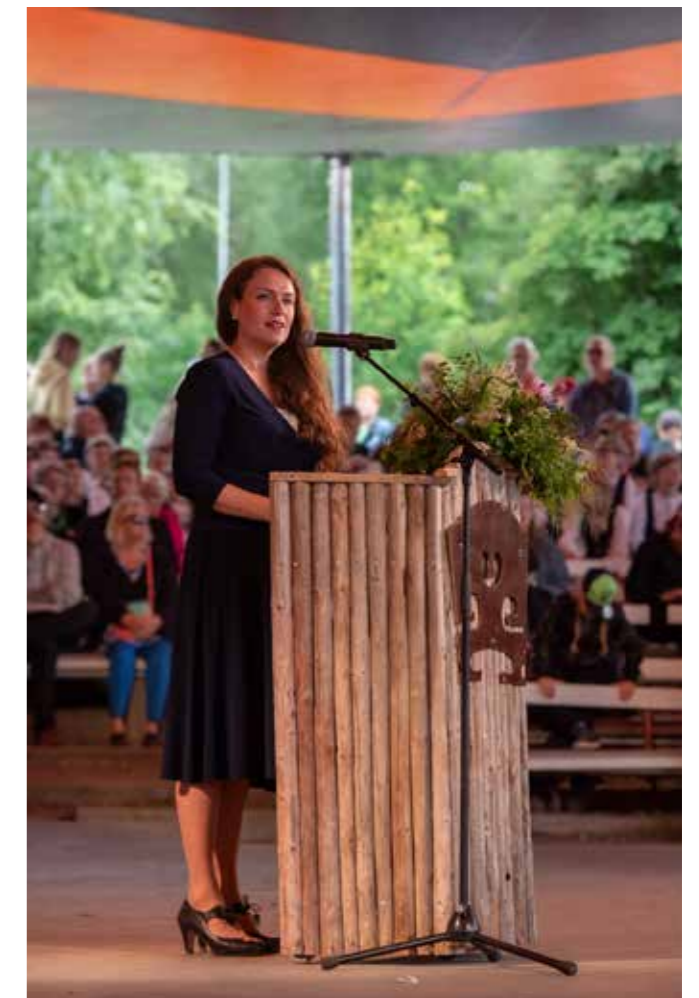
Alue- ja kuntaministeri Anna-Kaisa Ikonen.

ACC United, Antti Paalasen luotsaama hanuriparaati.