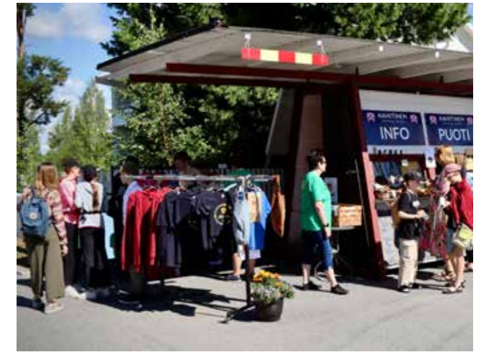
Juhlapihan Infopuoti.