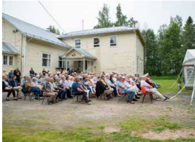
Kyläsoitto Vintturilla.