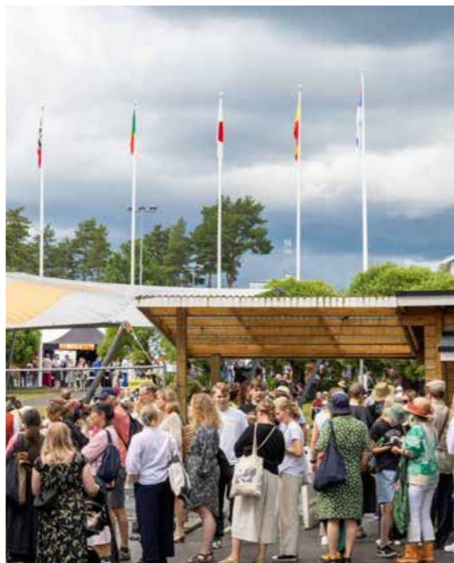
Yleisöä.