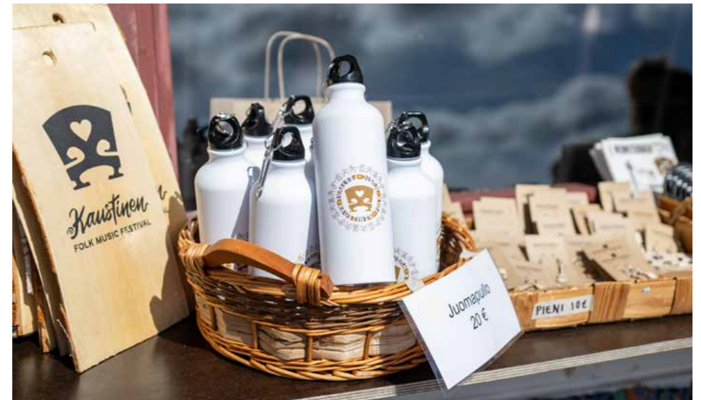
Kaustinen FMF-myyntiä.