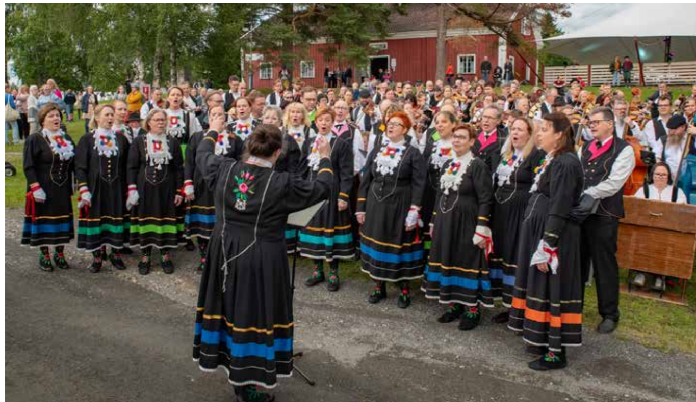
Kaustisen Hääkuoro.

Kansainvälisesti merkittävät yhteistyöfoorumit ovat EFN (European Folk Network) ja CIOFF (Conseil International des Organisations de Festivals de Folklore et d'Arts). Yhteistyöllä tavoitellaan rikastuttavia näkemyksiä ja vertailukohtia ohjelmistosuunnitteluun ja festivaalin käytännön toteuttamiseen, taloudellista synergiahyötyä esimerkiksi esiintyjävaihdon kautta sekä festivaalin kansainvälisten verkostojen ja maineen vahvistamista.