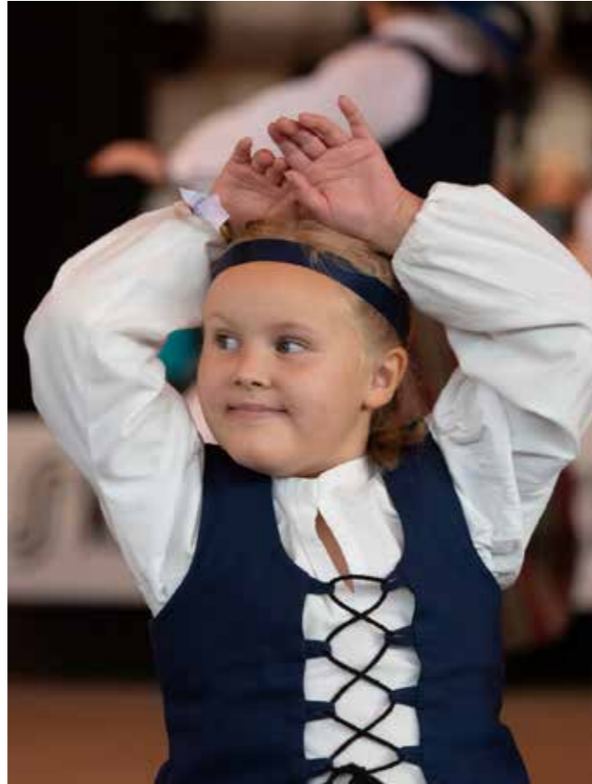
Ottoset. Kuva Krista Järvelä.