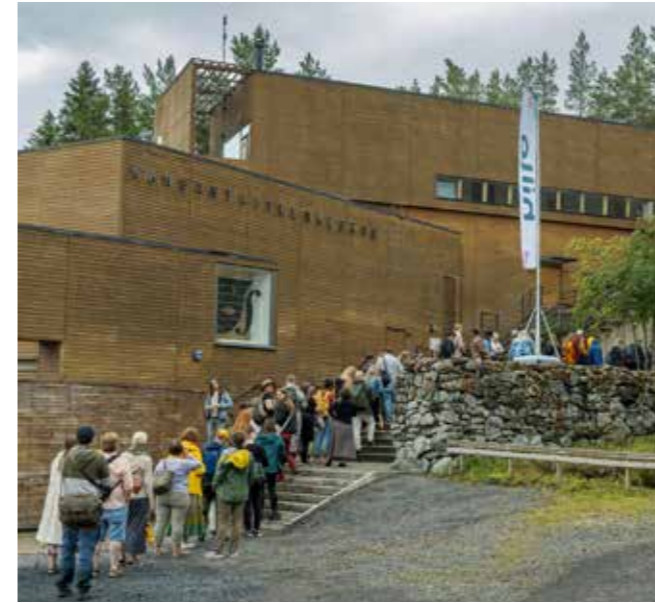
Kalliolle kukkulalle vie tieni konserttiin.

Festivaalijärjestelyjä suunniteltiin ja kehitettiin aktiivisesti talven ja kevään aikana. Festivaalialuetta kehitettiin toimivammaksi kokonaisuudeksi. Päivityksiä tehtiin mm. Pelimannitorin alueen toimivuuteen ja alueen yleiseen ilmeeseen. Soittosalin ja Sivutuvan somistukset toteutettiin yhteistyössä Kaustisen Marttojen kanssa. Festivaaliareenan, Trokan ja Mondon katokset pystytettiin Kaustisen kunnan toimeksiantona toukokuussa. Festivaalipuisto rakennettiin juhla- ja heinäkuun aikana. Jätehuolto ja siivous toteutettiin yhteistyössä paikallisten toimijoiden kanssa.